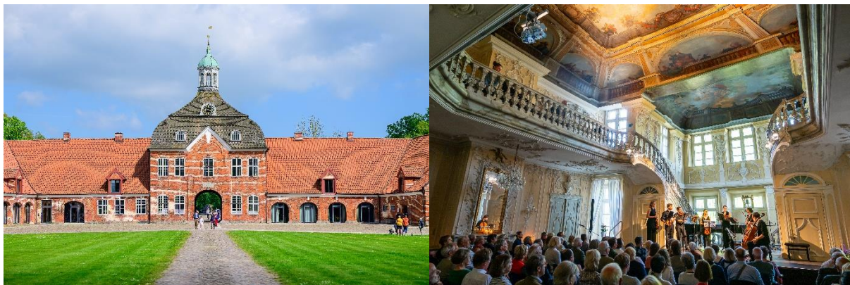
Kultur Gut Hasselburg

Folgende Instrumente sind zu besetzen: 2x Violine, 1x Viola, 1x Violoncello